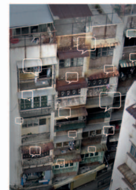
"Let them be heard" d'Anita Lam (Etats-Unis).