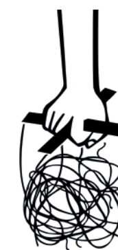
"The failure of control" d'Alessandro Albanese (Italie).