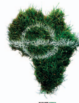
"Green Field of Hope" de Brian Huezio (Etats-Unis).